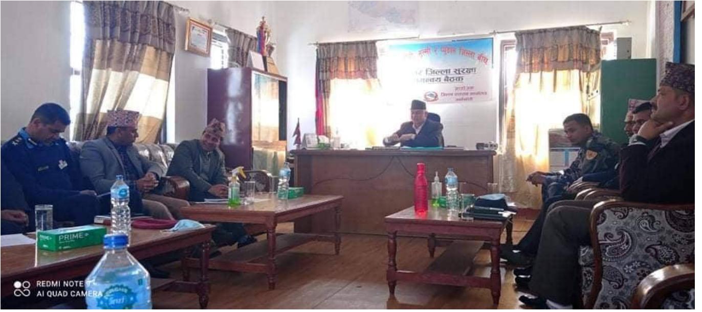
१. जिल्ला सुरक्षा समिति गुल्मी, अर्घाखाँची र प्यूठानका पदाधिकारीहरुको उपस्थितिमा जिल्ला प्रशासन कार्यालय, अर्घाखाँचीमा अन्तरजिल्ला सुरक्षा समन्वय बैठक ।