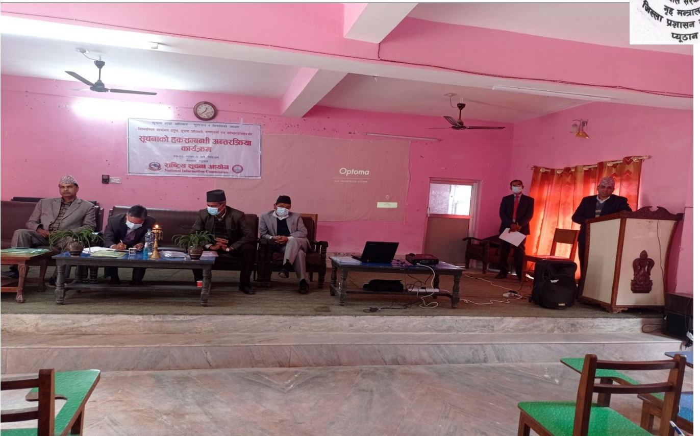
२. मिति २०७८ साल मंसिर २ गते राष्ट्रिय सूचना आयोगको आयोजनामा, राष्ट्रिय सूचना आयोगका प्रमुख आयुक्त, श्रीमान् सचिव ज्यू, लगायत पदाधिकारीहरुको उपस्थितिमा जिल्ला स्थित कार्यालय प्रमुख, सूचना अधिकारी, सञ्चारकर्मी एवम् सरोकारवालाहरूसँग सूचनाको हक सम्बन्धी अन्तरक्रिया कार्यक्रम ।